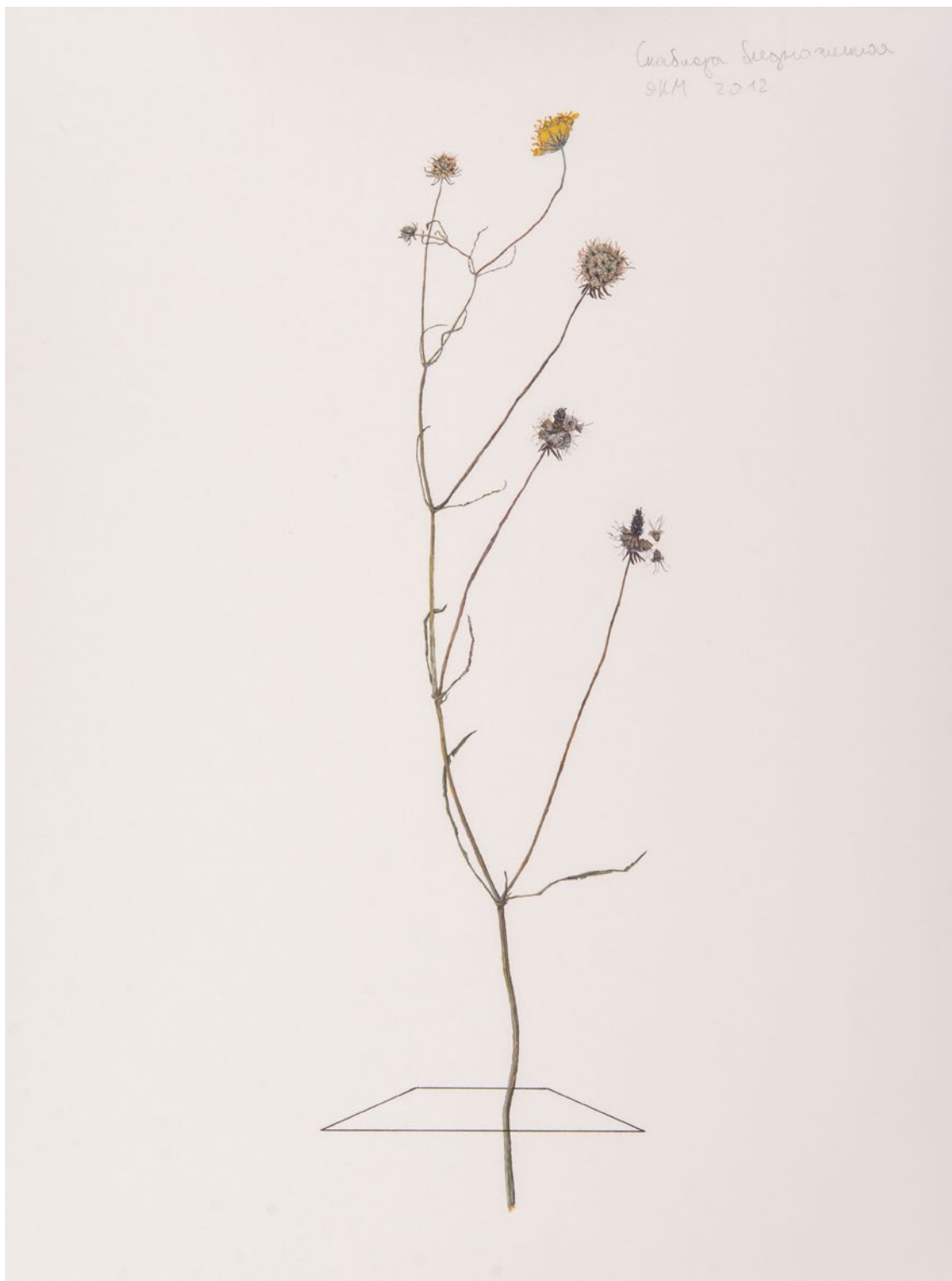
Илья Долгов / Гербарий. 2012 — наши дни / Акрил, бумага 30 x 40 см